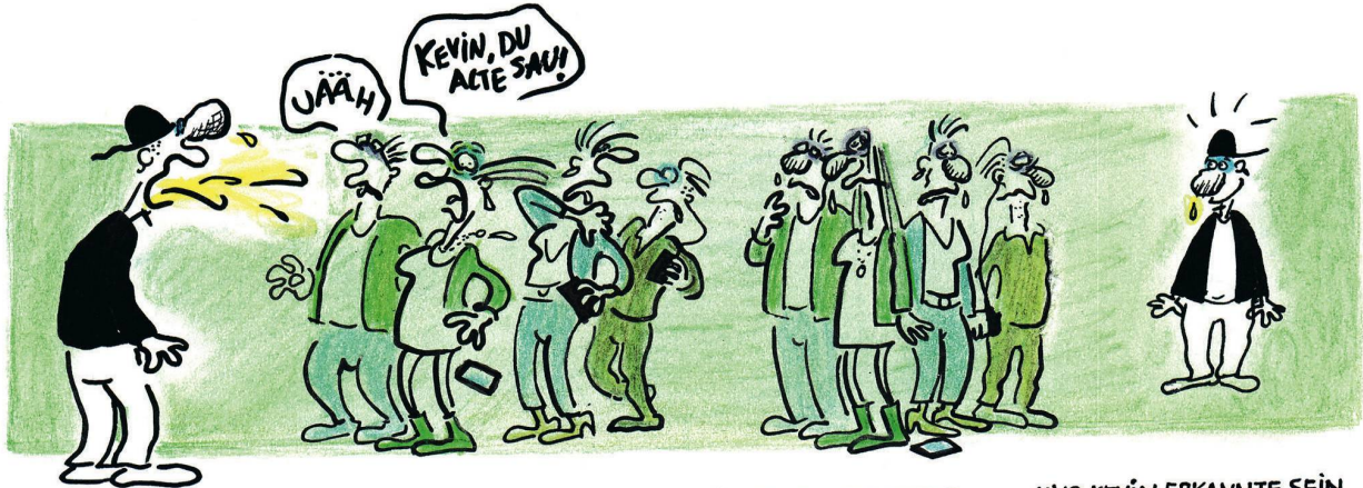
FREUNDE BEKAM ER SO NICHT...