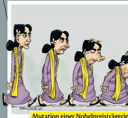
Mutation einer Nobelpreisträgerin