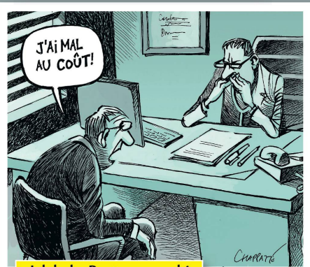
«Ich habe Portemo...weh!»