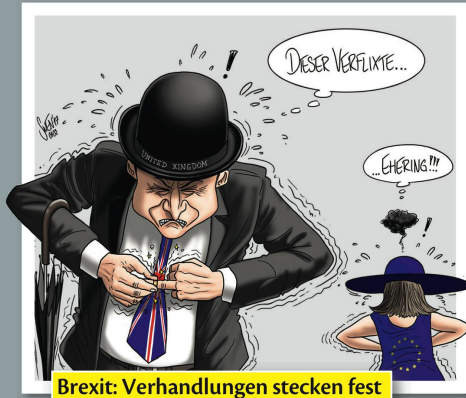
Brexit: Verhandlungen stecken fest