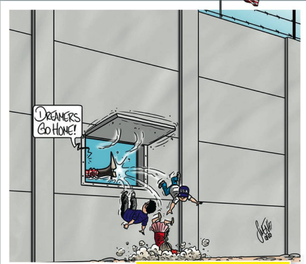
Mauer mit Babyklappe