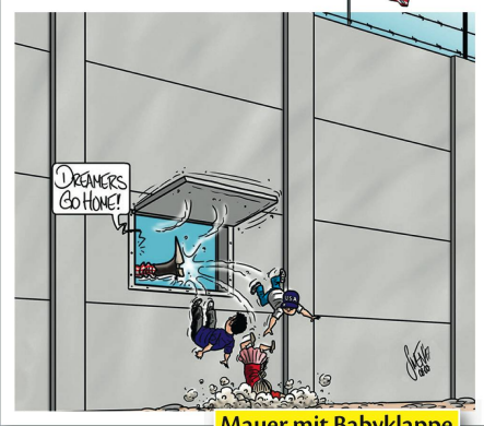
SWEN (SILVAN WEGMANN)