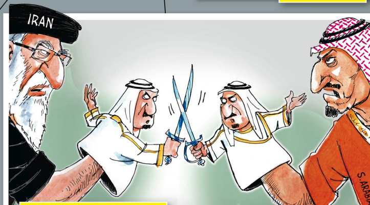
Säbelrasseln im Nahen Osten