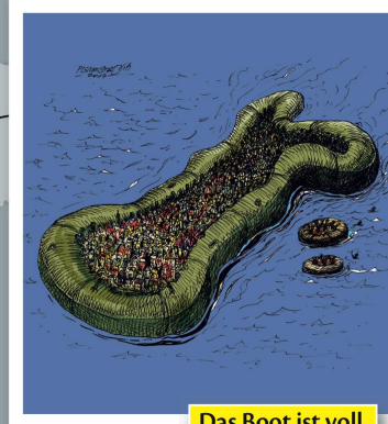
Das Boot ist voll.