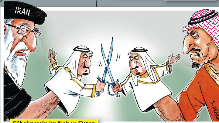
Säbelrasseln im Nahen Osten