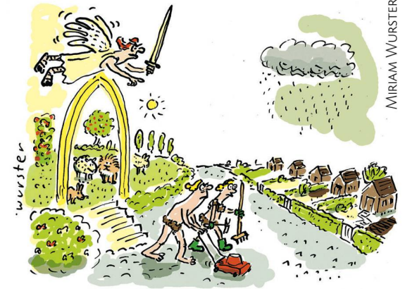
Vertreibung aus dem Paradies in den Schrebergarten