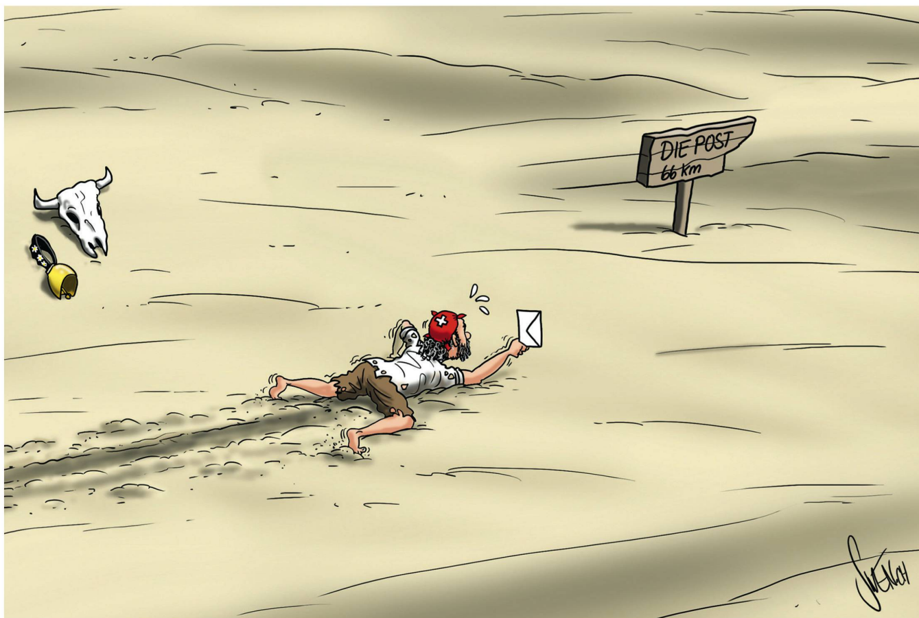
SWEN (SILVAN WEGMANN)