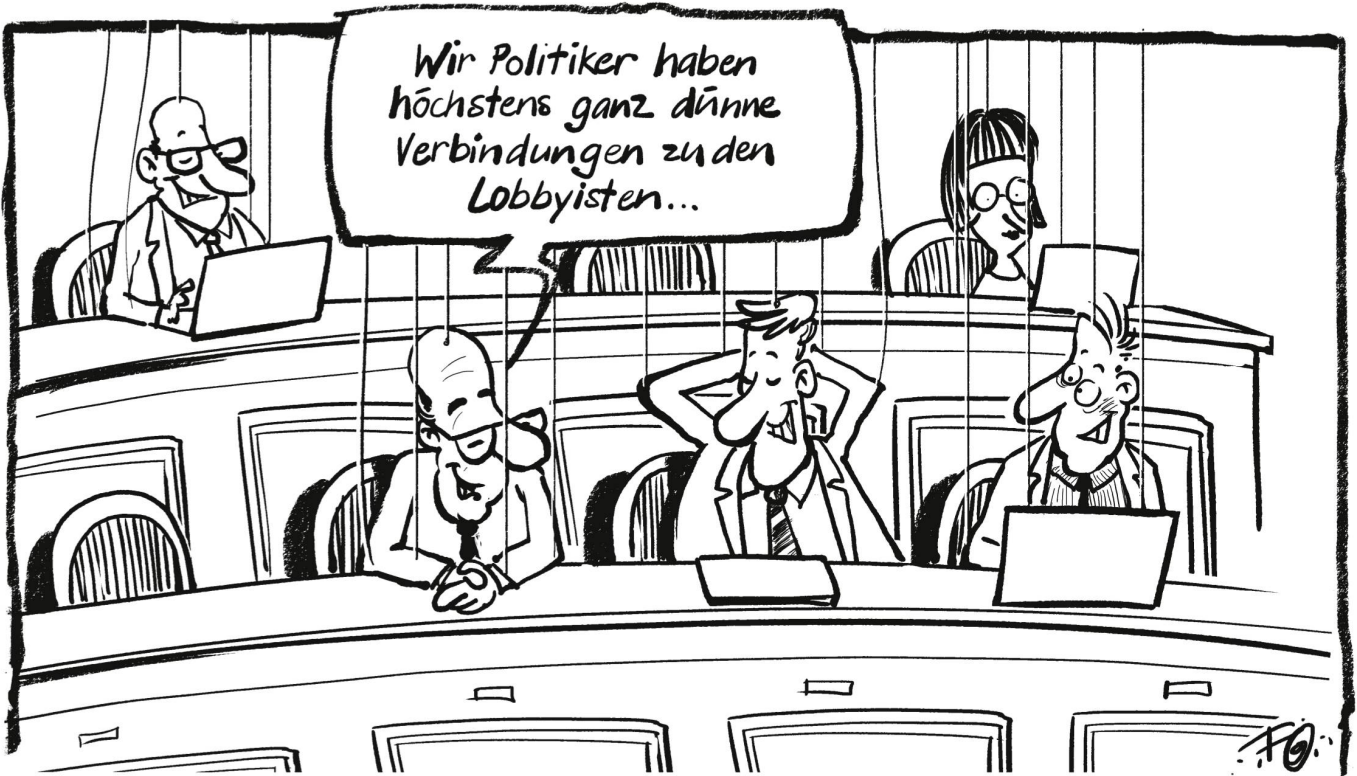
Die Zahl der Interessenbindungen zwischen Schweizer Parlamentariern und Lobbygruppen stieg seit 2007 um 20 Prozent. Für ihre Mandate kassieren die Politiker teils viele Tausend Franken pro Jahr.