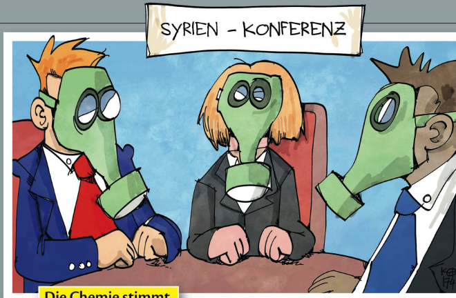
Die Chemie stimmt.