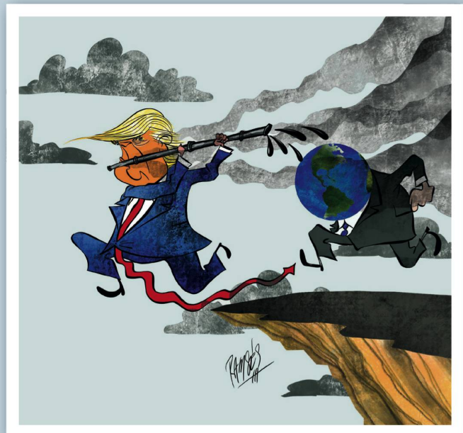
RAMONES MORALES IZQUIERDO