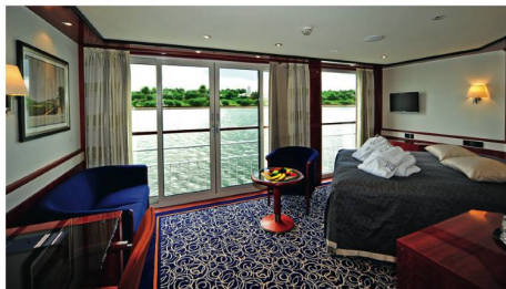
Deluxe Suite (22 m²) mit franz. Balkon