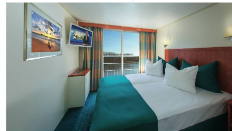
2-Bettkabine Mittel- und Oberdeck Superieur mit franz. Balkon

* Im Flugpaket (Fr. 180.-) enthalten, vorab buchbar | * Fak. Ausflug nur an Bord buchbar | Programmänderungen vorbehalten | Reederei/Partnerfirma: River Advice