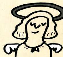
Mach mal Pause!