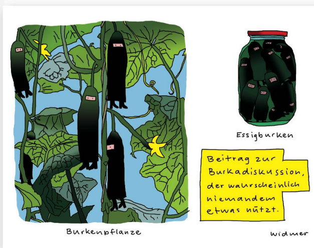
Platz 3: Ruedi Widmers krampflosender Beitrag zum Burkaverbot.