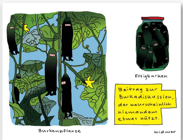
Platz 3: Ruedi Widmers krampflosender Beitrag zum Burkaverbot.