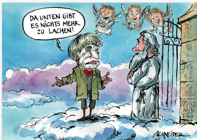
Platz 2: Carlo Schneiders Nachruf auf Dimitri trifft den Nerv der Zeit.

Die 10. Ausgabe von «Gezeichnet» wird im Dezember 2017 wieder im Berner Museum für Kommunikation stattfinden. (red.)