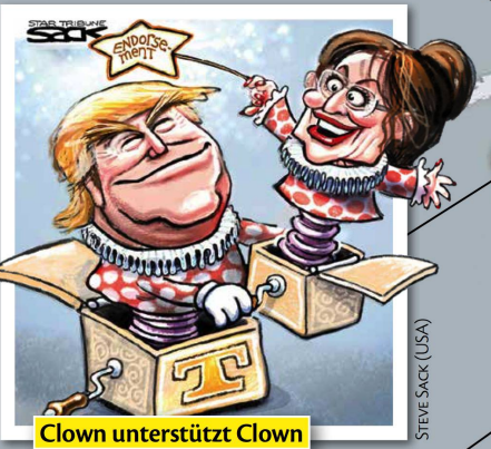
Clown unterstützt Clown