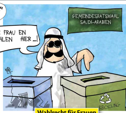
Wahlrecht für Frauen