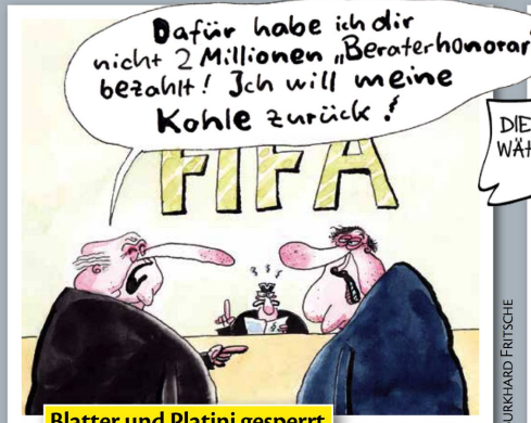
Blatter und Platini gesperrt