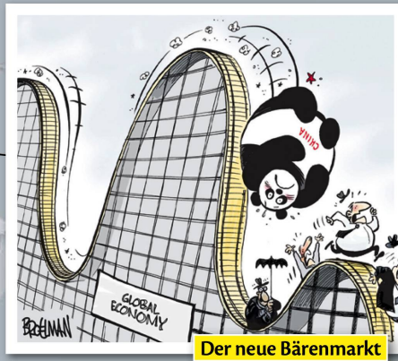
Der neue Bärenmarkt