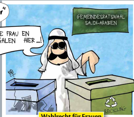
Wahlrecht für Frauen