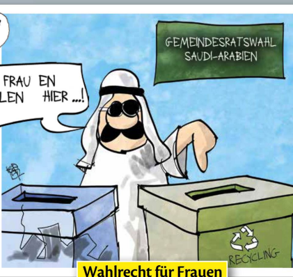
Wahlrecht für Frauen