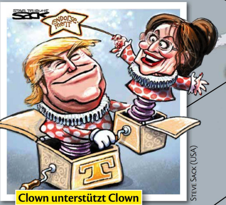
Clown unterstützt Clown