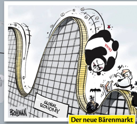
Der neue Bärenmarkt