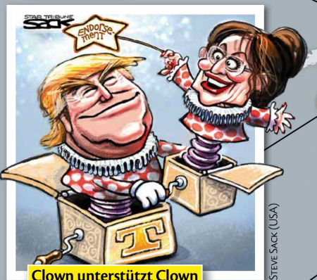
Clown unterstützt Clown