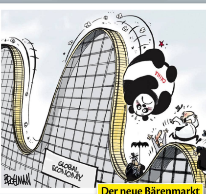
Der neue Bärenmarkt