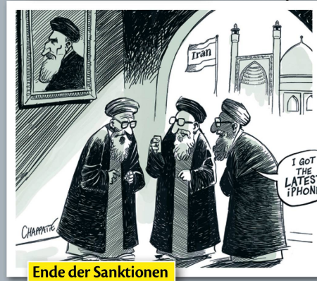
Ende der Sanktionen