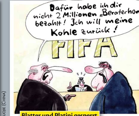
Blatter und Platini gesperrt