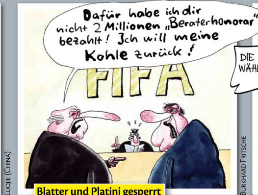
Blatter und Platini gesperrt