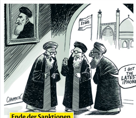
Ende der Sanktionen