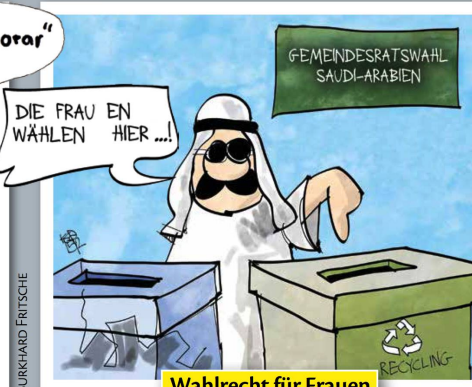
Wahlrecht für Frauen