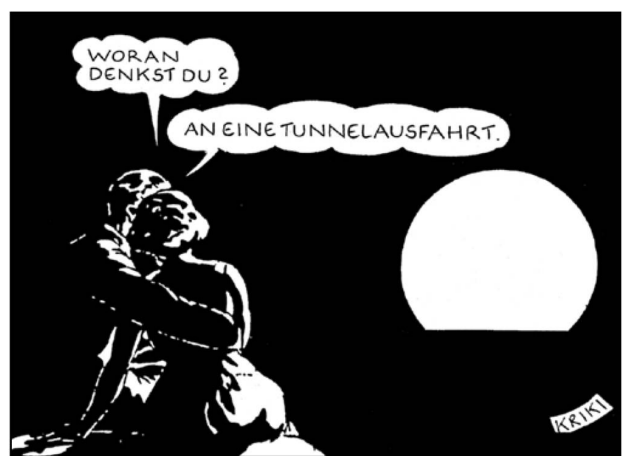
KRIKI (CHRISTIAN GROSS)