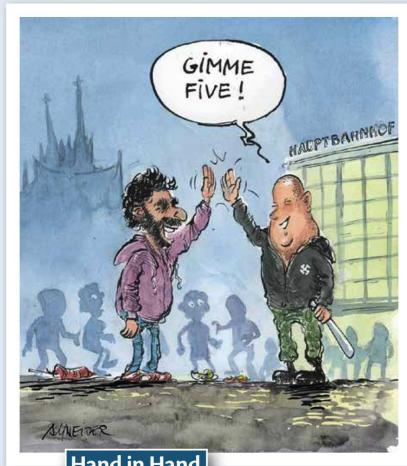
Hand in Hand