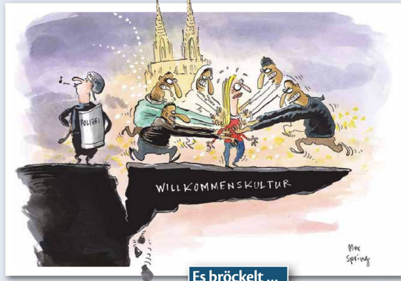
Es bröckelt ...