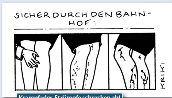
Krampfader-Strümpfe schrecken ab!