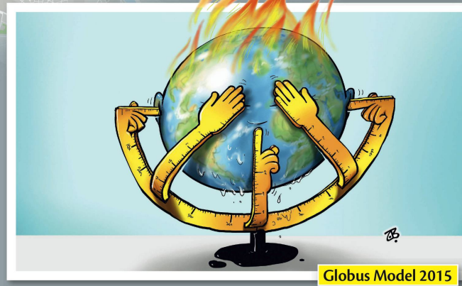
Globus Model 2015