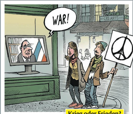
Krieg oder Frieden?