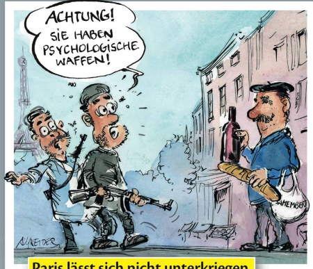
Paris lässt sich nicht unterkriegen