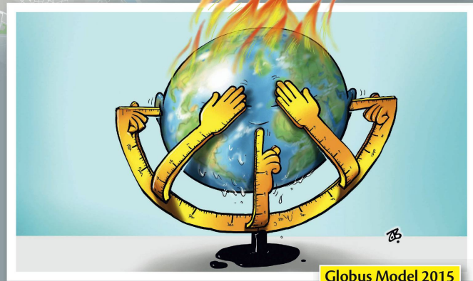
Globus Model 2015