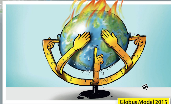
Globus Model 2015