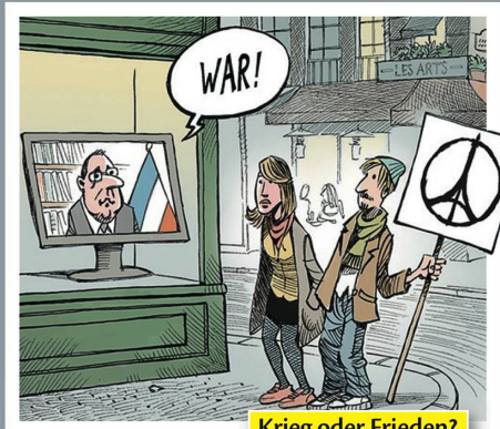
Krieg oder Frieden?