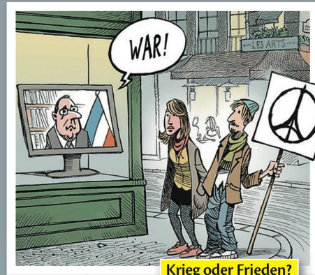
Krieg oder Frieden?