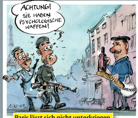
Paris lässt sich nicht unterkriegen