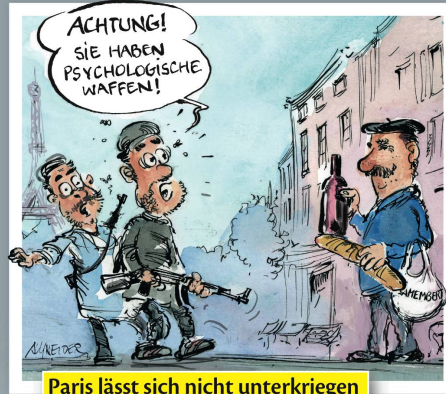
Paris lässt sich nicht unterkriegen