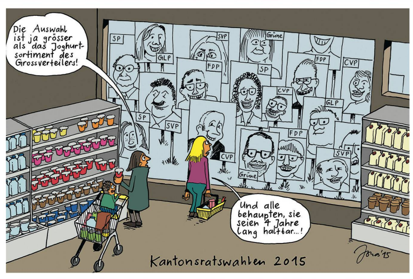
Wahlherbst 2015: Noch nie haben sich so viele Kandidaten für einen Sitz unter der Bundeskuppel beworben. Doch Politologen konstatieren: Mehr Köpfe, weniger Inhalte. ..... Jonas Brühwiler | Willisauer Bote

Swen (Silvan Wegmann) | Aargauer Zeitung