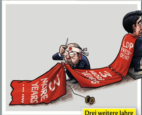
Drei weitere Jahre