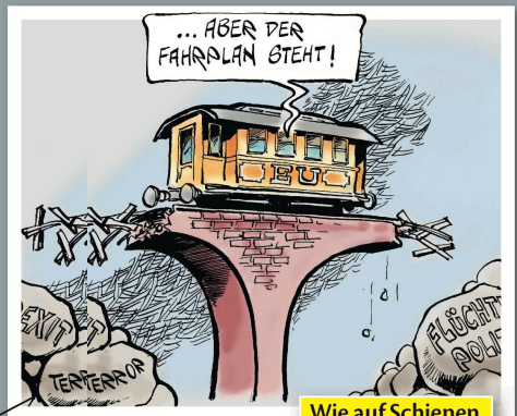
Wie auf Schienen