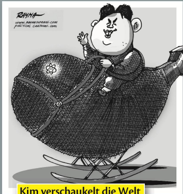
Kim verschaukelt die Welt