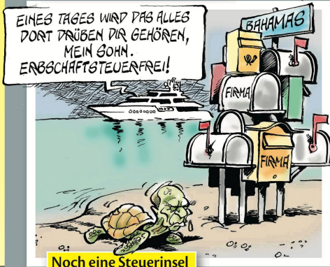
Noch eine Steuerinsel