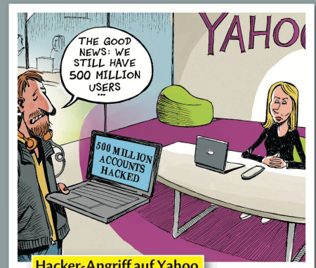
Hacker-Angriff auf Yahoo