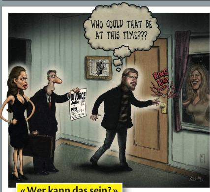
« Wer kann das sein? »