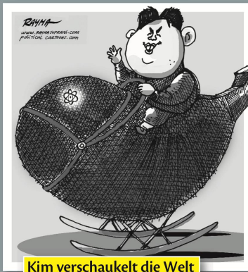
Kim verschaukelt die Welt