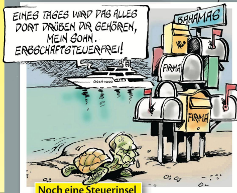
Noch eine Steuerinsel