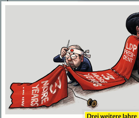
Drei weitere Jahre