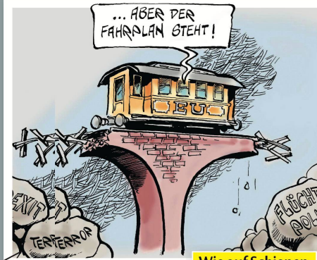
Wie auf Schienen