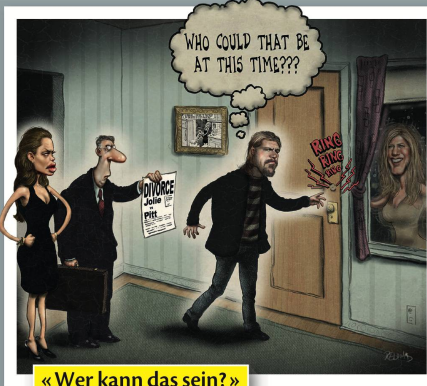
«Wer kann das sein?»