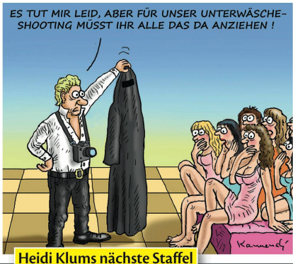
Heidi Klums nächste Staffel