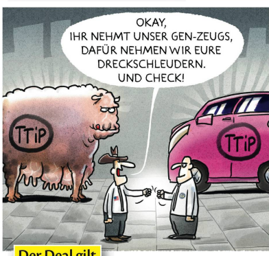
Der Deal gilt