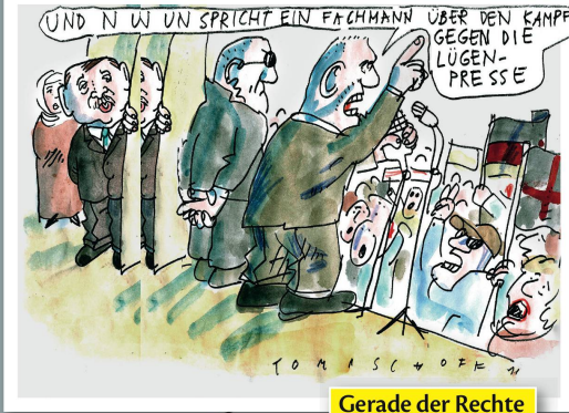
Gerade der Rechte