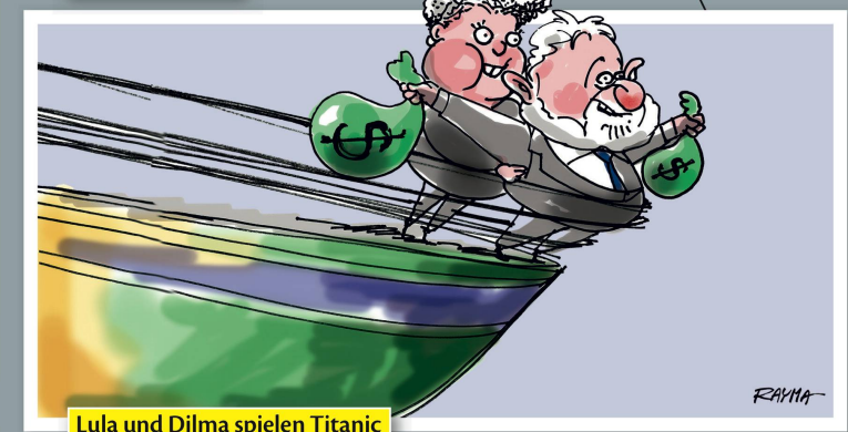
Lula und Dilma spielen Titanic