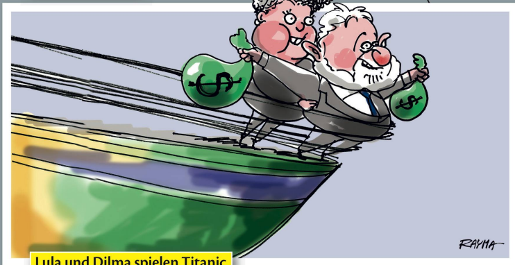
Lula und Dilma spielen Titanic