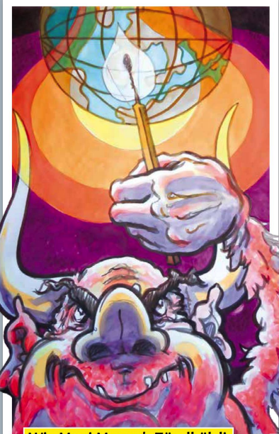
Wie Mani Matter's Zündhölzli