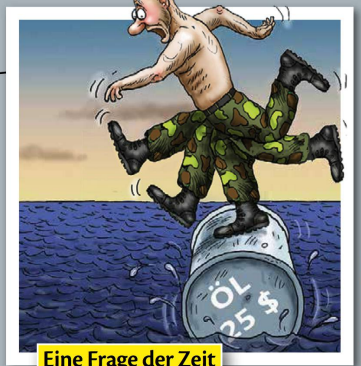
Eine Frage der Zeit