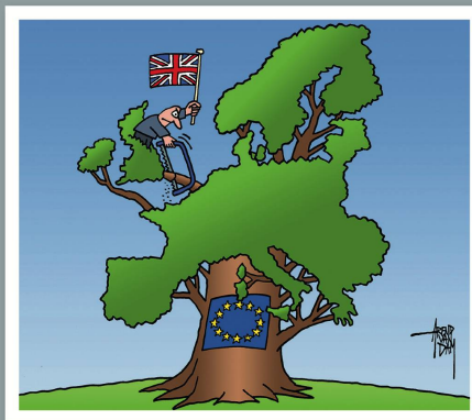
AREND VAN DAM