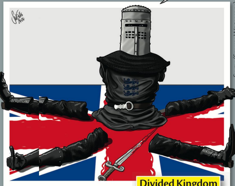
SWEN (SILVAN WEGMANN)