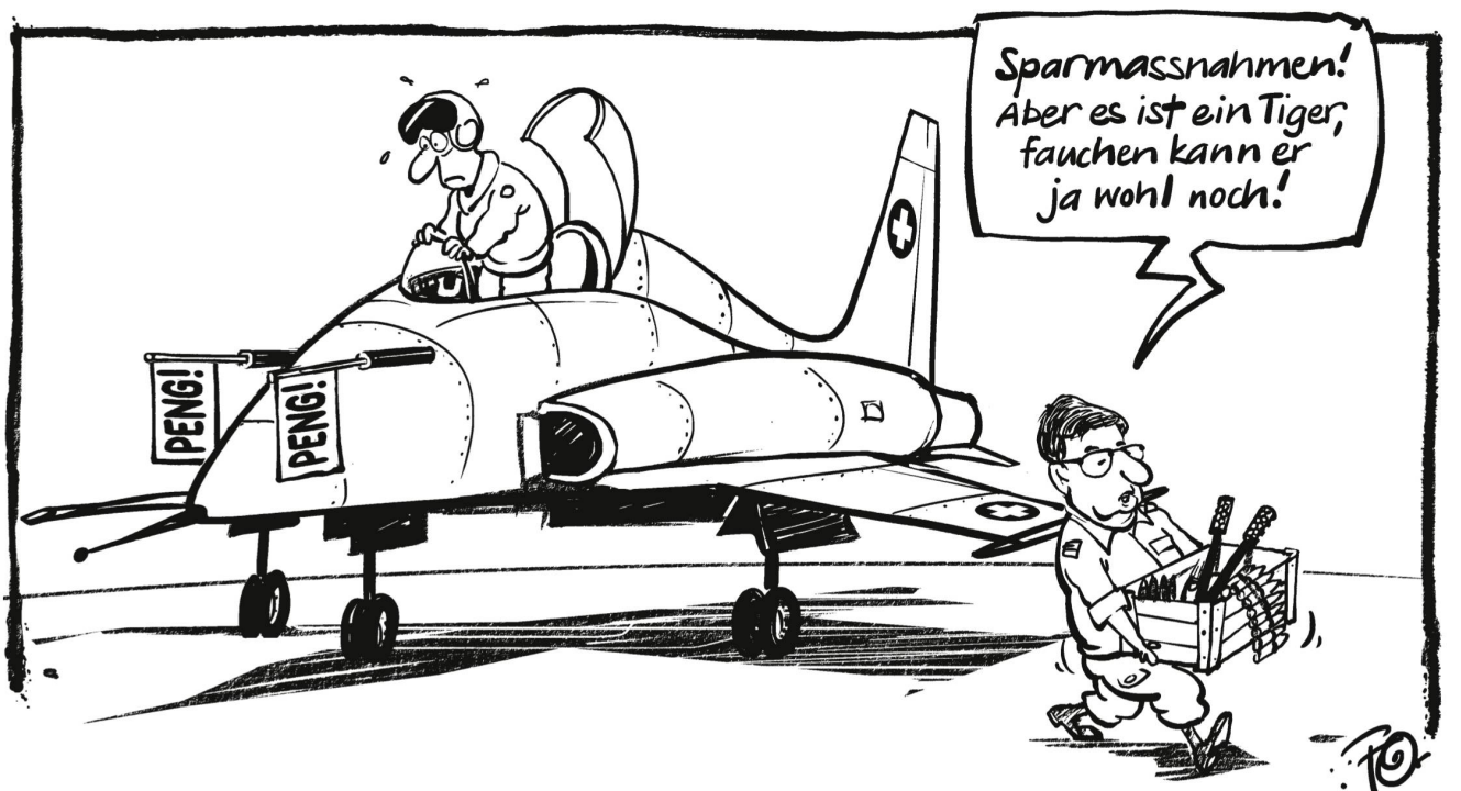
Aus finanziellen Gründen prüft Luftwaffenchef Aldo Schellenberg bei den Flugzeugen der Tigerflotte die Kanonen zu entfernen. Innerhalb der Luftwaffe regt sich aber Widerstand ...