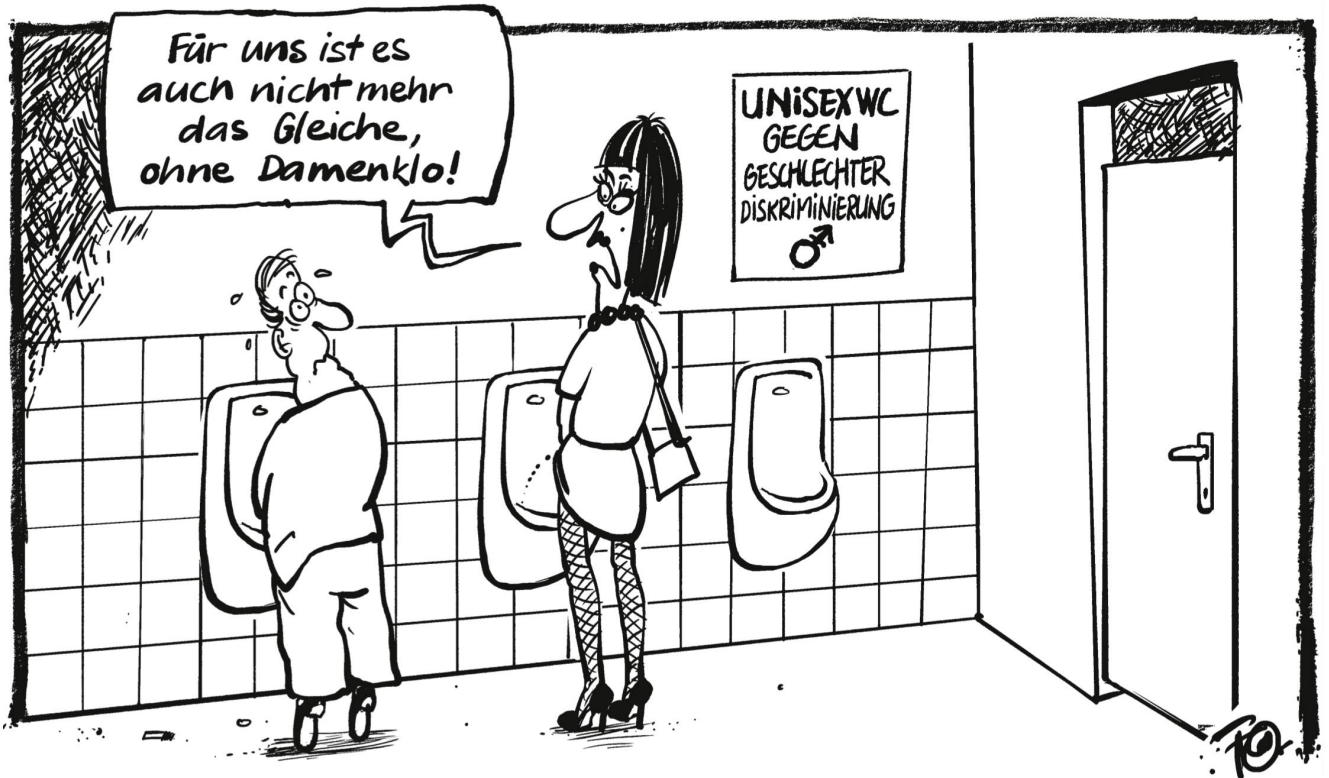
In Zürich führte das erste Restaurant in der Schweiz Unisex-Toiletten ein. Die Abschaffung getrennter Toiletten zugunsten der Gleichberechtigung ist ein Anliegen der Gender-Aktivistin.