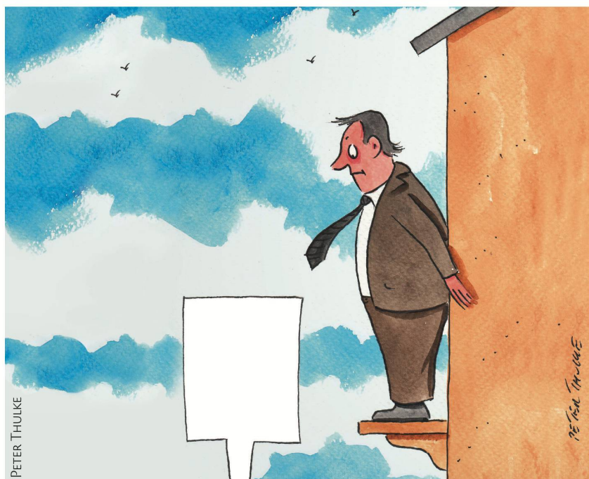
BEI ÄHNLICH LAUTENDER POINTE HAT DAS LOS ENTSCHIEDEN.