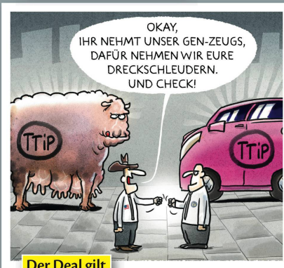
Der Deal gilt