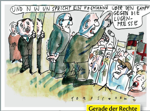
Gerade der Rechte