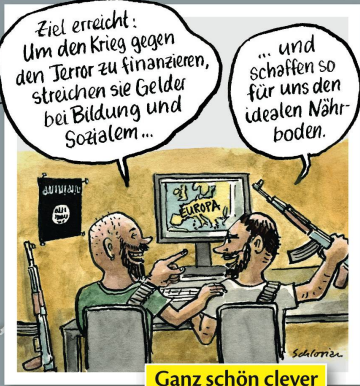
Ganz schön clever