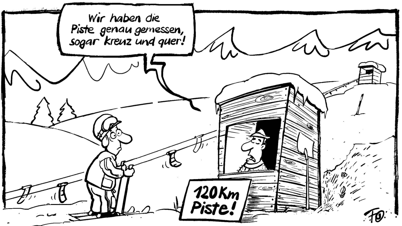
Jedes dritte Skigebiet in der Schweiz wirbt mit zu vielen Pistenkilometern. So hat zum Beispiel das Skigebiet Corvatsch statt der versprochenen 120 km in Wirklichkeit nur 42 km Piste zu bieten ...