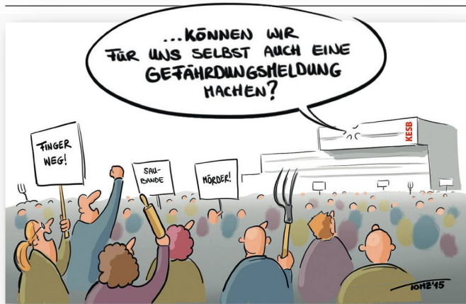
CARTOONS: TOMZ (TOM KÜNZLI)