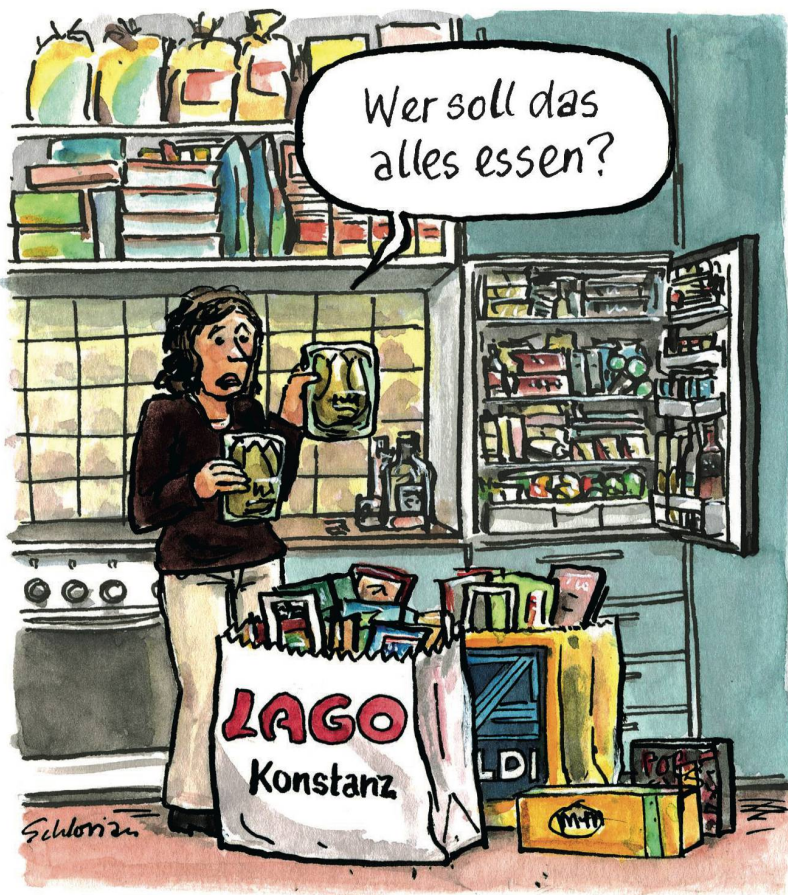
SCHLORIAN (STEFAN HALLER)

Abkehr vom Euro-Mindestkurs: Die Schweiz ist in grosser Sorge.