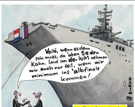
Hollande & Putin