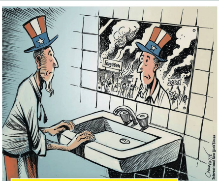
Ferguson und der müde Uncle Sam