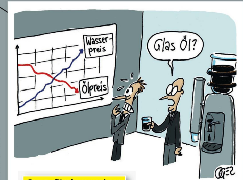
Opec fördert weiter