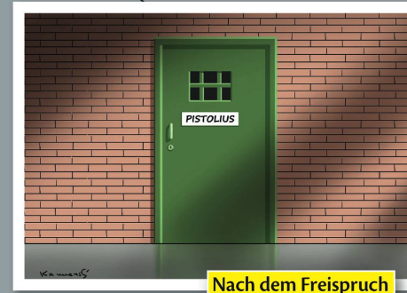
Nach dem Freispruch