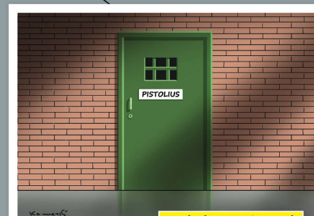
Nach dem Freispruch