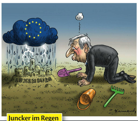
Juncker im Regen