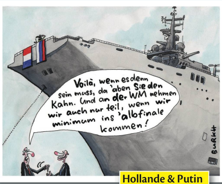
Hollande & Putin