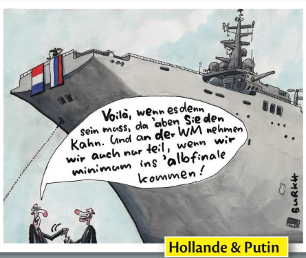
Hollande & Putin