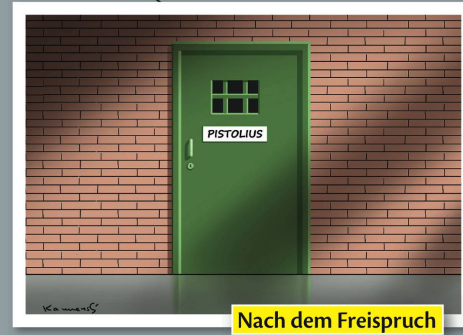
Nach dem Freispruch