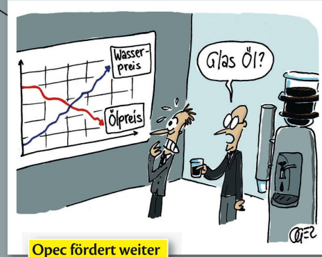
Opec fördert weiter