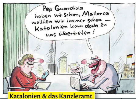
Katalonien & das Kanzleramt