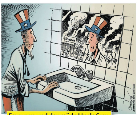
Ferguson und der müde Uncle Sam