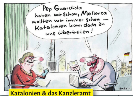
Katalonien & das Kanzleramt