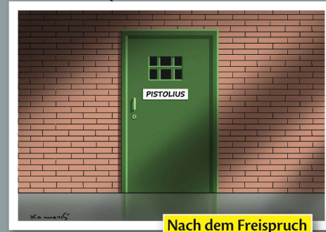
Nach dem Freispruch