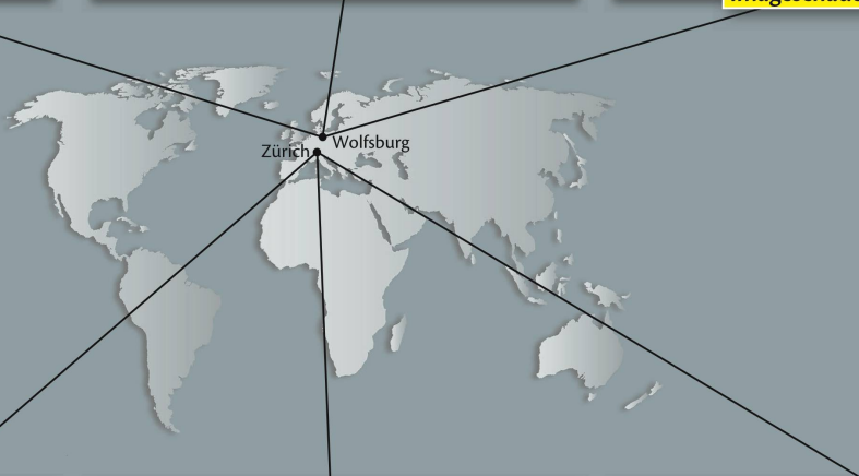
Imageschaden Made in Germany