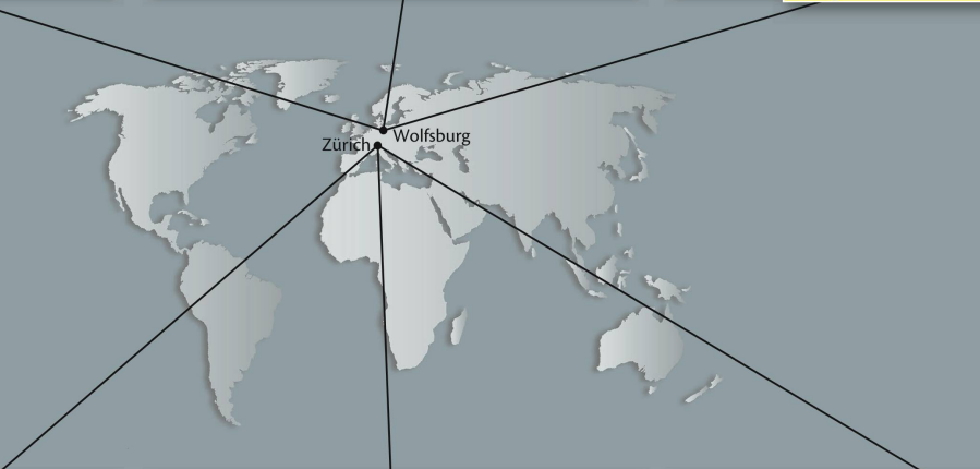
Imageschaden Made in Germany