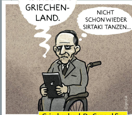
Griechenland: Da Capo al fine