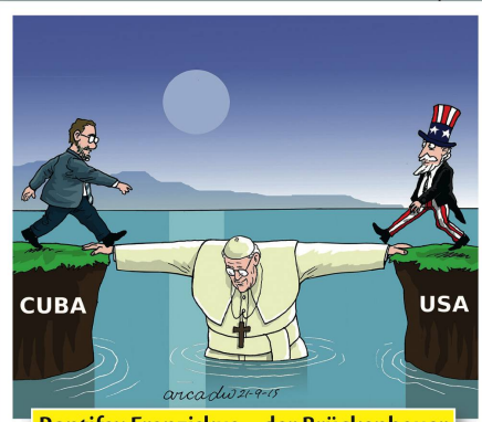
Pontifex Franziskus – der Brückenbauer