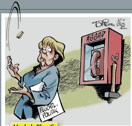
Merkels Plan C