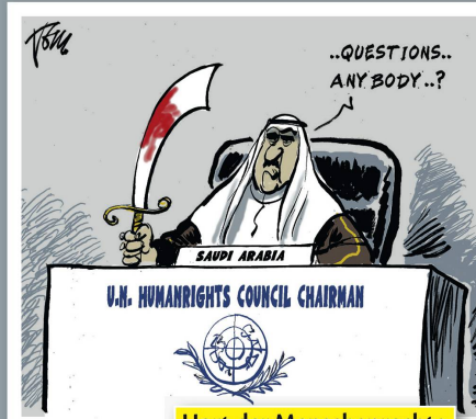
Hort der Menschenrechte