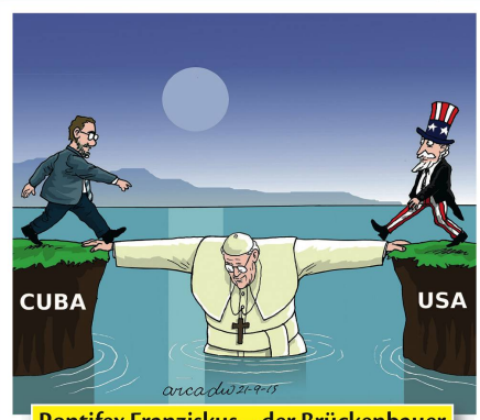
Pontifex Franziskus – der Brückenbauer