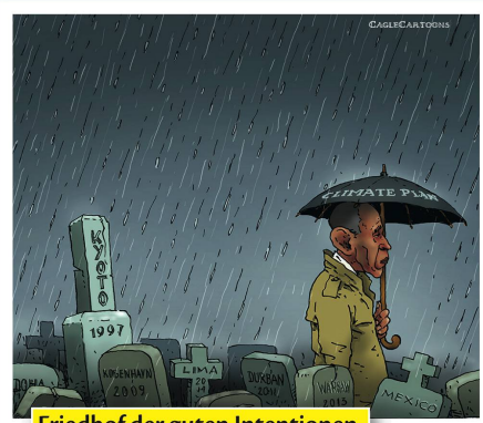
Friedhof der guten Intentionen