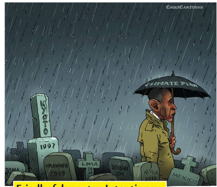
Friedhof der guten Intentionen