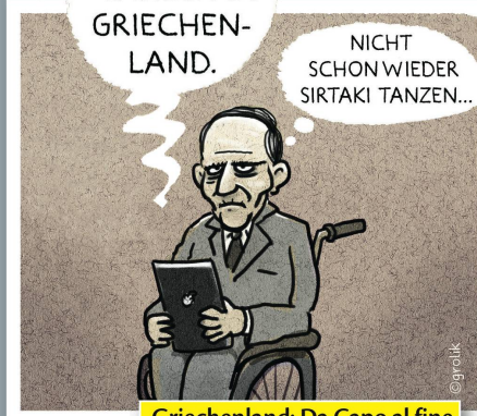
Griechenland: Da Capo al fine