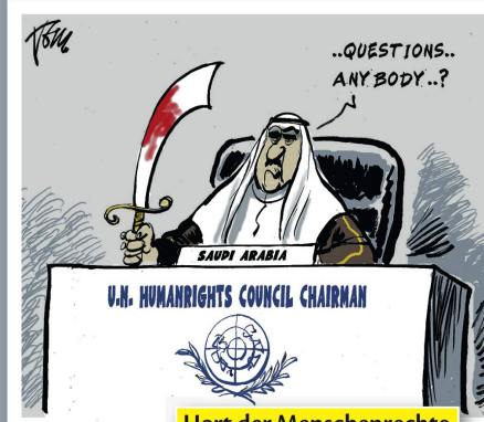
Hort der Menschenrechte