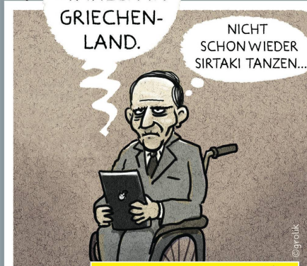
Griechenland: Da Capo al fine