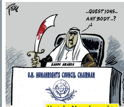
Hort der Menschenrechte