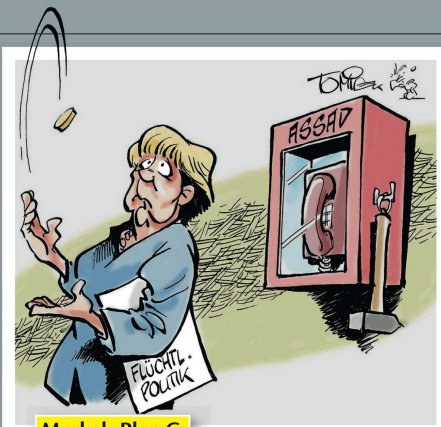
Merkels Plan C