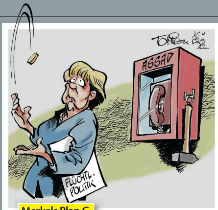
Merkels Plan C