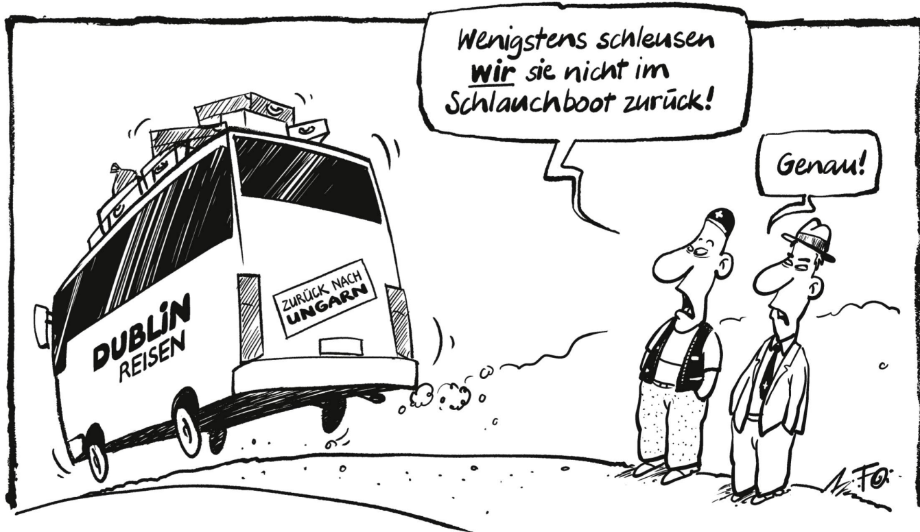
Das Migrationsamt beruft sich auf die Dublin-Verordnung , wonach Flüchtlinge in dem EU-Staat Asyl beantragen müssen, den sie zuerst betreten haben, und schiebt weiterhin Asylbewerber nach Ungarn zurück...