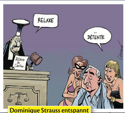
Dominique Strauss entspannt