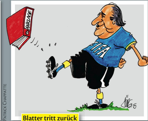
Blatter tritt zurück