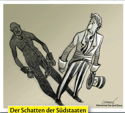
Der Schatten der Südstaaten