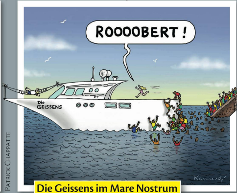
Die Geissens im Mare Nostrum