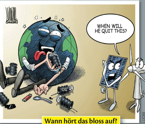
Wann hört das bloss auf?