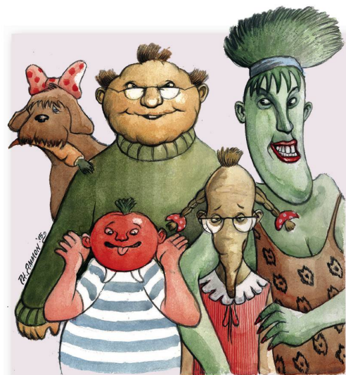
- EINE SCHRECKLICH VEGANE FAMILIE.