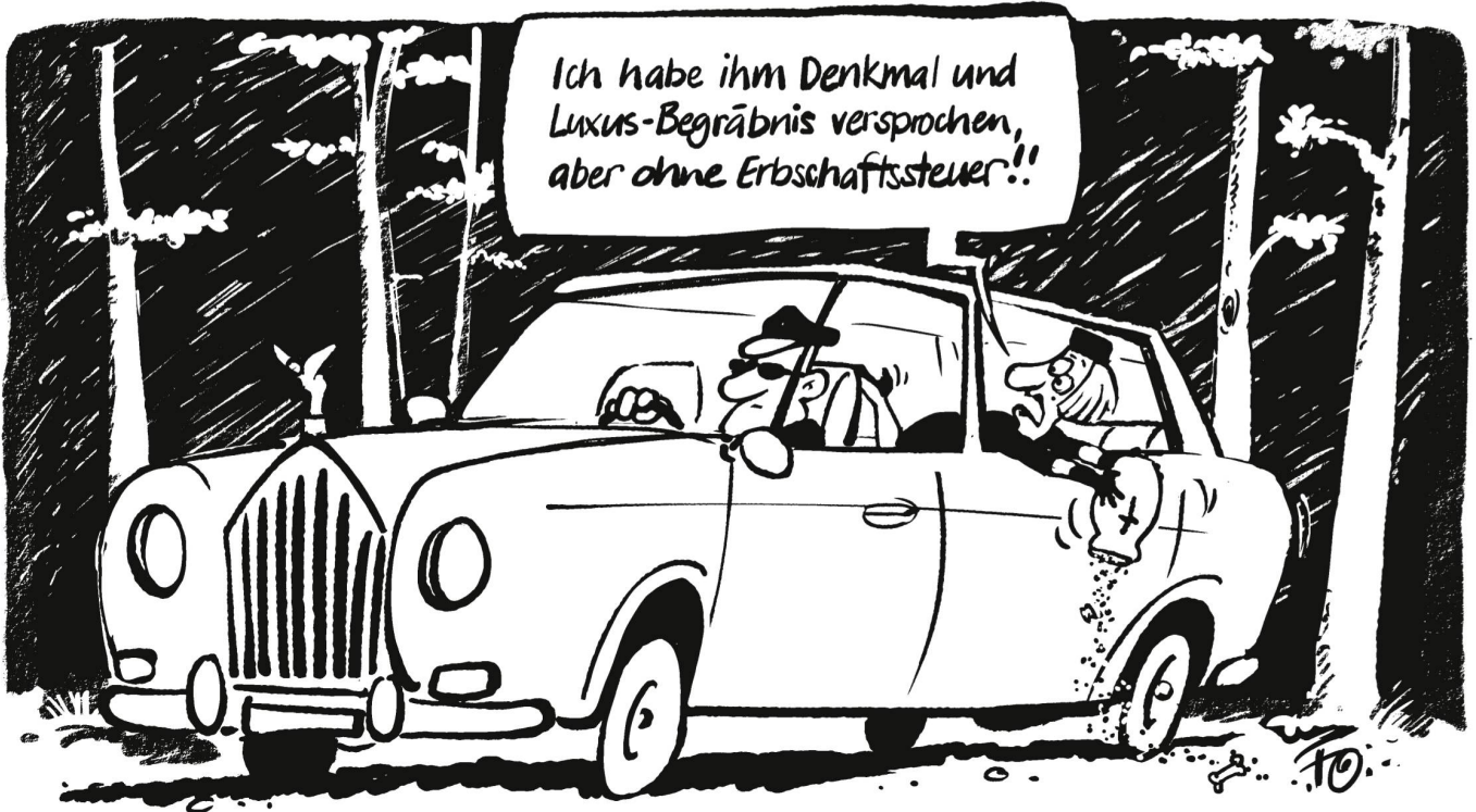
Heute besitzen die reichsten zwei Prozent etwa so viel wie die restlichen 98 Prozent der Bevölkerung. Mit der Erbschaftssteuer soll sich das ändern.