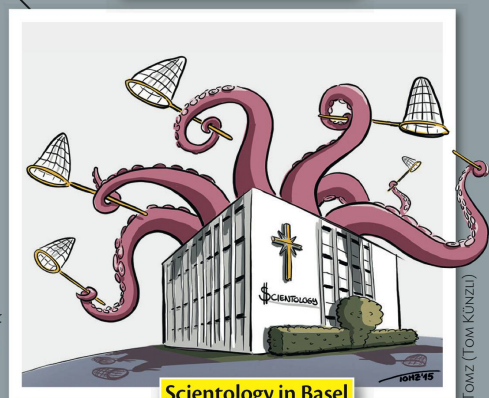
Scientology in Basel