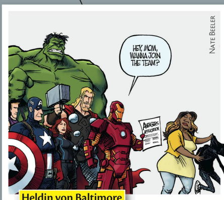
Heldin von Baltimore