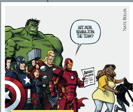
Heldin von Baltimore