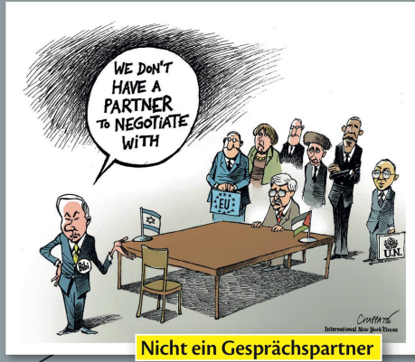
Nicht ein Gesprächspartner