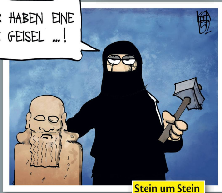
Stein um Stein