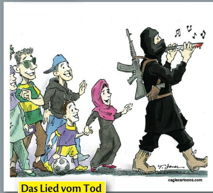
Das Lied vom Tod