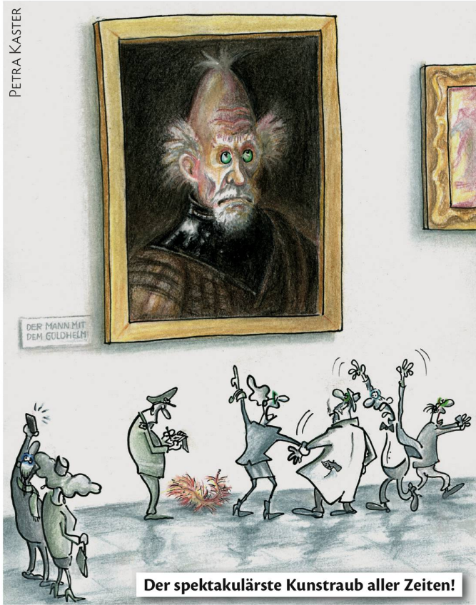
Der spektakulärste Kunstraub aller Zeiten!