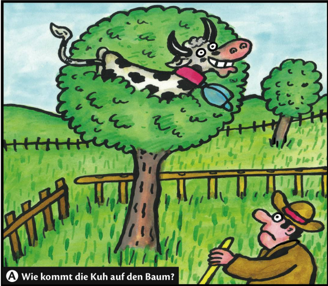
A Wie kommt die Kuh auf den Baum?