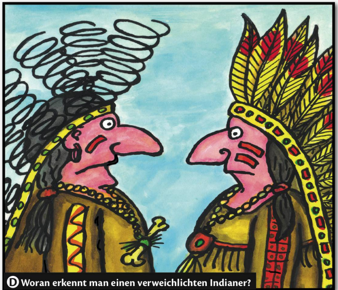
D Woran erkennt man einen verweichtlichen Indianer?