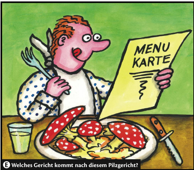
E Welches Gericht kommt nach diesem Pilzgericht?