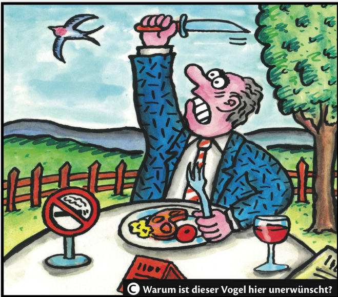
C Warum ist dieser Vogel hier unerwünscht?