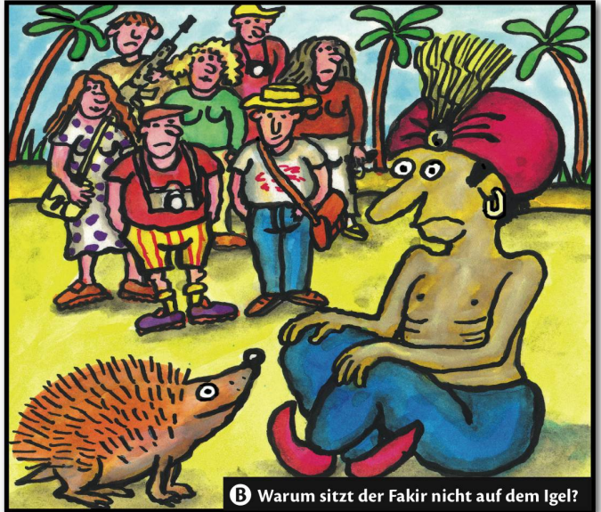
B Warum sitzt der Fakir nicht auf dem Igel?